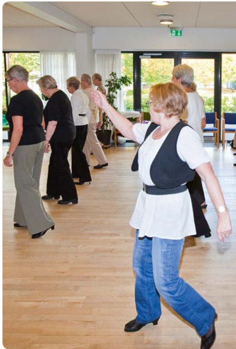
Line dance i Aktivitetscentret på Sydvestvej

Der er tilbud om genoptræning, når der er brug for, at man kan genvinde eller vedligeholde sine færdigheder.