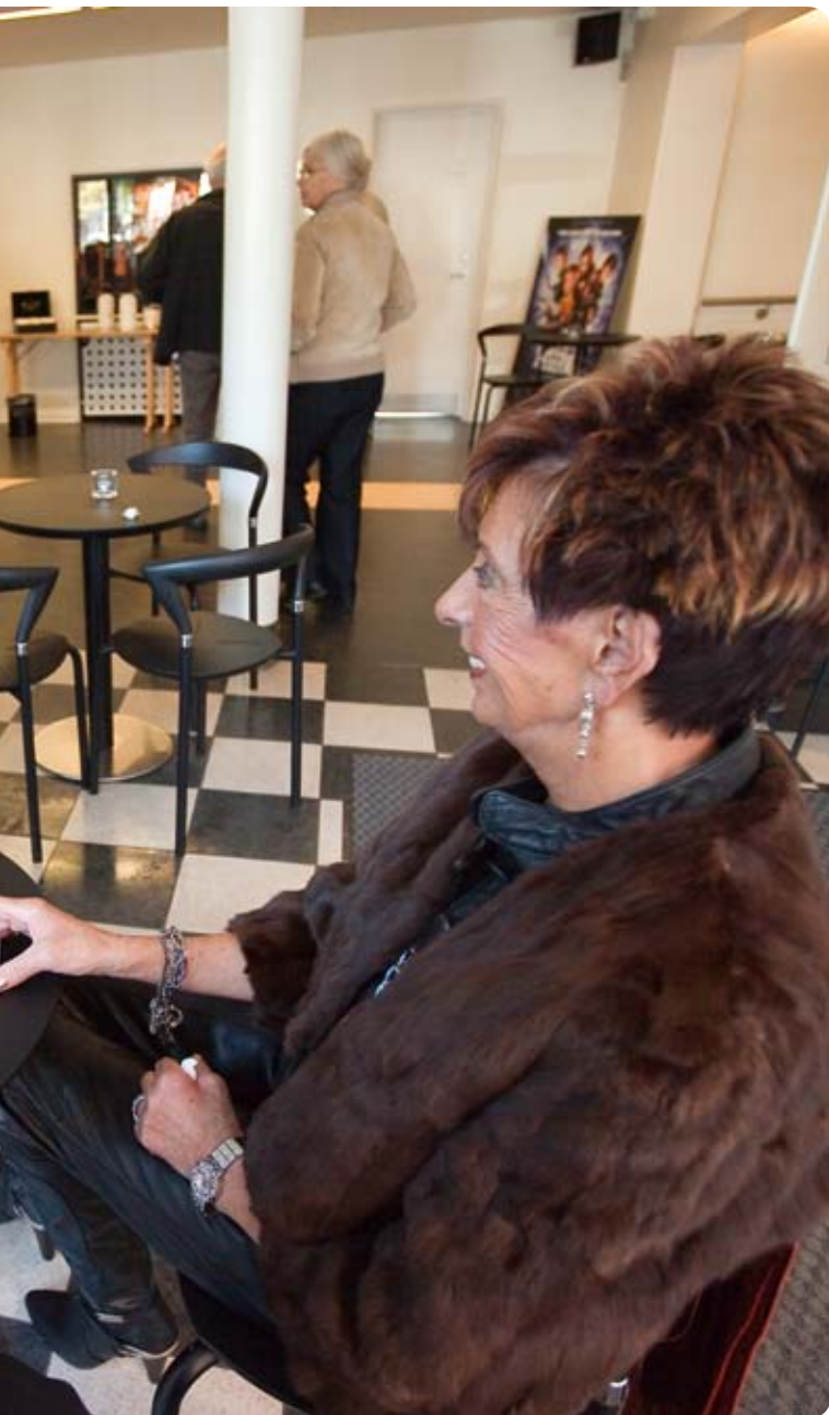
Seniobio i Glostrup Biograf