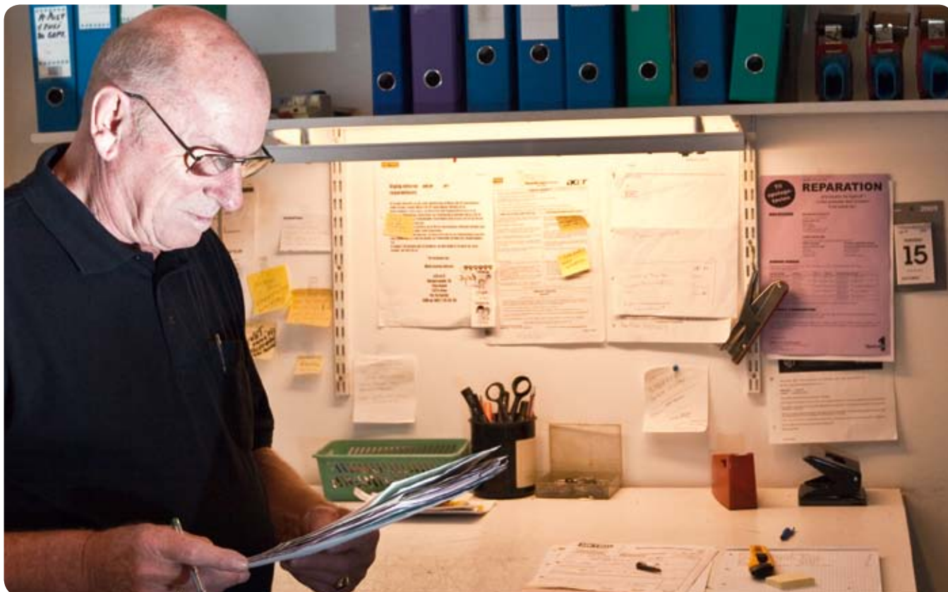
Seniormedarbejder på arbejde i Metro

For nogle borgere fylder arbejdslivet det meste af tiden, så der opstår et tomrum, når der ikke længere er et arbejde at stå op til. Samtidig vil det for nogen være en lettelse for fysikken ikke længere at skulle arbejde; mens det for andre og stadig flere ældre vil være en indgang til et meget aktivt pensionistliv, fordi kroppen ikke er slidt ned. Derfor er det vigtigt at forberede overgangen fra arbejdsliv til pension.