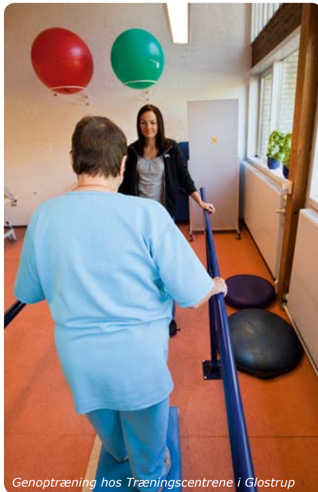
Genoptræning hos Træningscentrene i Glostrup