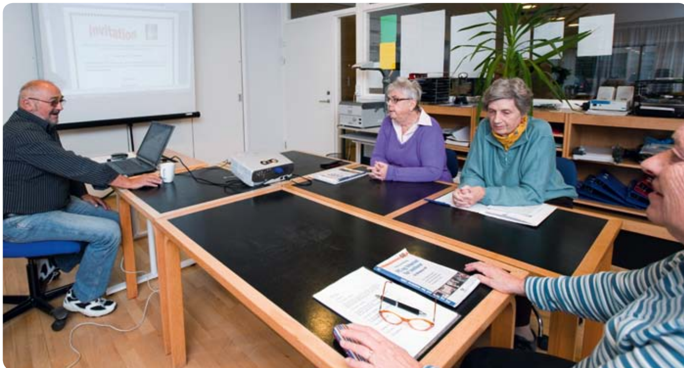
EDB undervisning på Aktivitetscentret på Sydvestvej

Kommunikation og dialog til og fra mennesker og institutioner handler om respekt for forskellige udgangspunkter og tilgange til verden. Hvor der tidligere kun var få og enkle måder at kommunikere på, er der nu mange forskellige veje til dialog og kontakt mellem mennesker.