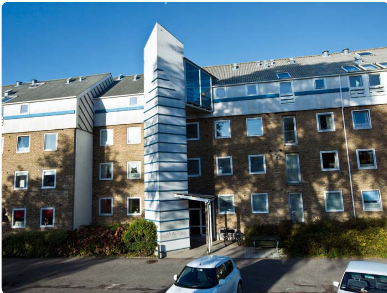
Ældrevenligt byggeri i Herlev til inspiration i Glostrup

Glostrup Kommune er præget af mange etageejendomme, der ikke i alle tilfælde er egnede til at blive ældre i. Det skal ses i sammenhæng med, at der bliver stadig flere ældre og dermed sandsynligvis også flere, der har behov for at bo i stueplan eller med elevator. Der er derfor behov for, at boligforeninger og kommune sammen ser på det samlede boligudbud i kommunen, da Glostrup Kommune ikke vil være i stand til at tilgodese det stigende behov for ældrevenlige boliger. Samtidigt skal borgerne mo-